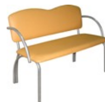
Диваны, банкетки, секции для посетителей