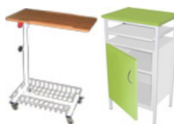
Прикроватные столики и тумбы